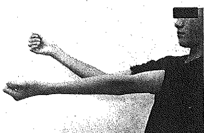
離断性骨軟骨炎によって右腕の曲げ伸ばしが十分にできなくなった中学生