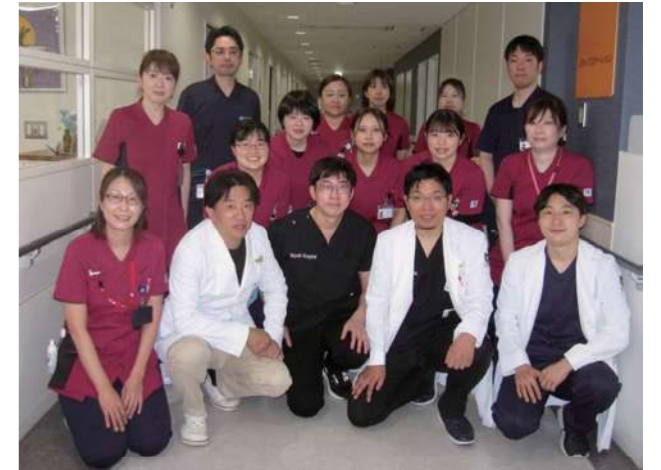
徳島県立三好病院 高度先進関節脊椎センターにて

徳島県の県西部は“四国のへそ”と呼ばれてきたように、香川県・愛媛県・高知県の3県と接し、医療圏も四国4県に跨っています。したがって県西部(四国のへそ)の医療を充実させることは、徳島県内のみならず四国全体の医療を充実させることに繋がると考えられます。またその取組みを県西部だけでなく県内全域にも広げ、大学病院や関連施設と密に連携することで、重症患者の受け入れもスムーズに行い、安心した医療を提供できることを目指します。