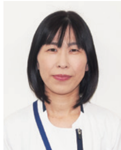
看護部東病棟6階 乳がん看護認定看護師 副看護師長