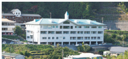
自然に囲まれた那賀町立上那賀病院

通常の外来においては、「どのような方も診る」をモットーに、医師はそれぞれに専門領域がありますが、総合診療医であると医師ひとりひとりが自覚して、子